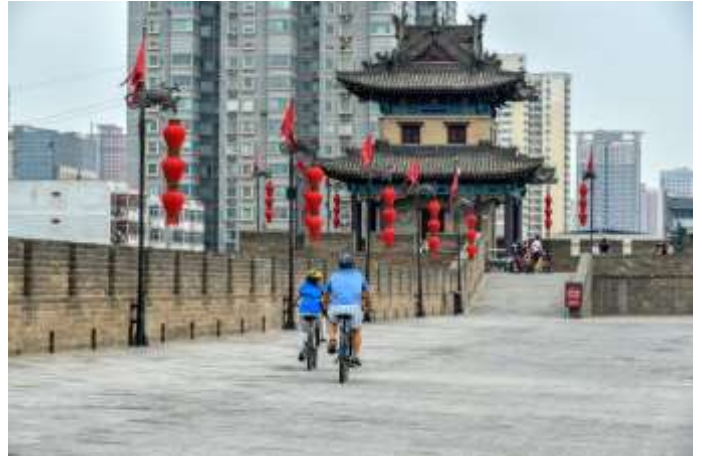
พาท่านชม วัดลามะกว้างเหริน (Guangren Temple)

นำท่านไป กำแพงเมืองโบราณซีอาน (Xi'an City Wall ) (ระยะทางและเวลาเดินทางขึ้นอยู่กับโรงแรมที่พัก)สร้างขึ้นในสมัยราชวงศ์หมิงมีความยาว 14 กิโลเมตร และมีความสูง 39 ฟุต ปัจจุบันทรุดโทรมแต่ยังคงล้อมรอบเมืองซีอานอยู่และได้มีการบูรณะให้อยู่ในสภาพเดิม โดยด้านนอกจัดเป็นสวนสาธารณะให้ผู้คนเข้ามาเที่ยวชมและพักผ่อน