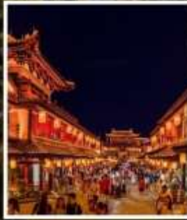
ถนนคนเดินว่านโซ่วกง