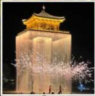
อู๋นวิโจว