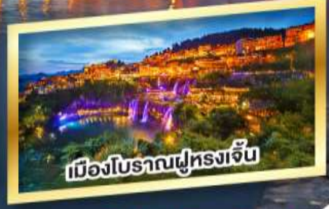
เมืองโบราณฝูหลงเจิน