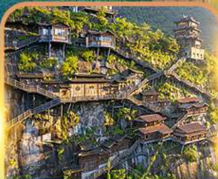
หมู่บ้านริมผาวังเซียนกู่