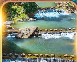
น้ำตกสามชั้นวังเซียน