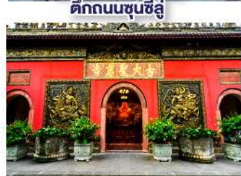
วัดต้าฉือ