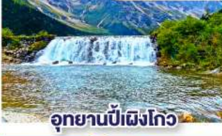
อุทยานπίฝั่งโกว