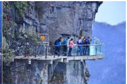
หน้าผาลอยฟ้าทางเดินกระจก