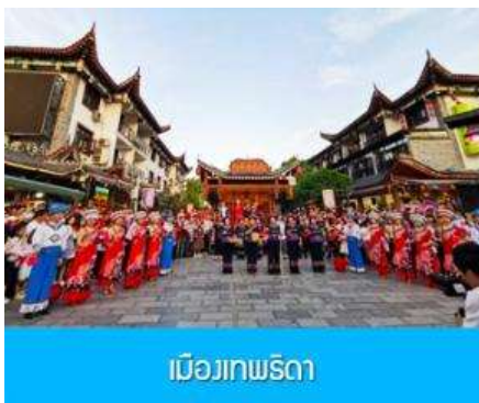
เมืองเทพริดา