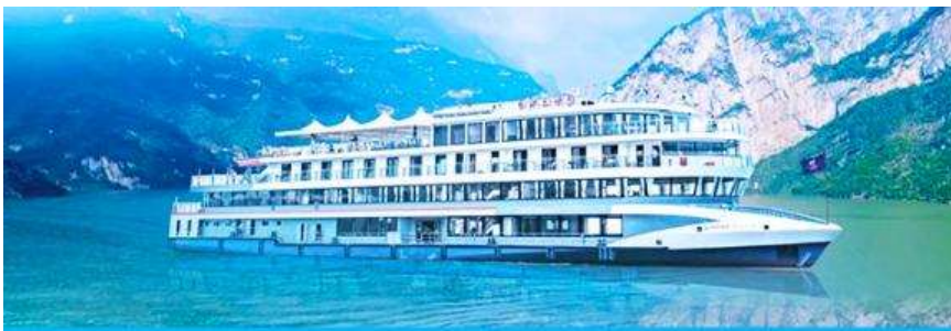
ล่องเรือชมเขื่อนสามผา