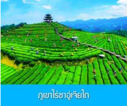
ภูเขาไร่ชาอู๋เจียไถ

พักที่ โรงแรม ENSHI XIPU HOTEL ระดับ 4 ดาวท้องถิ่นหรือเทียบเท่าในเมืองเินซือ