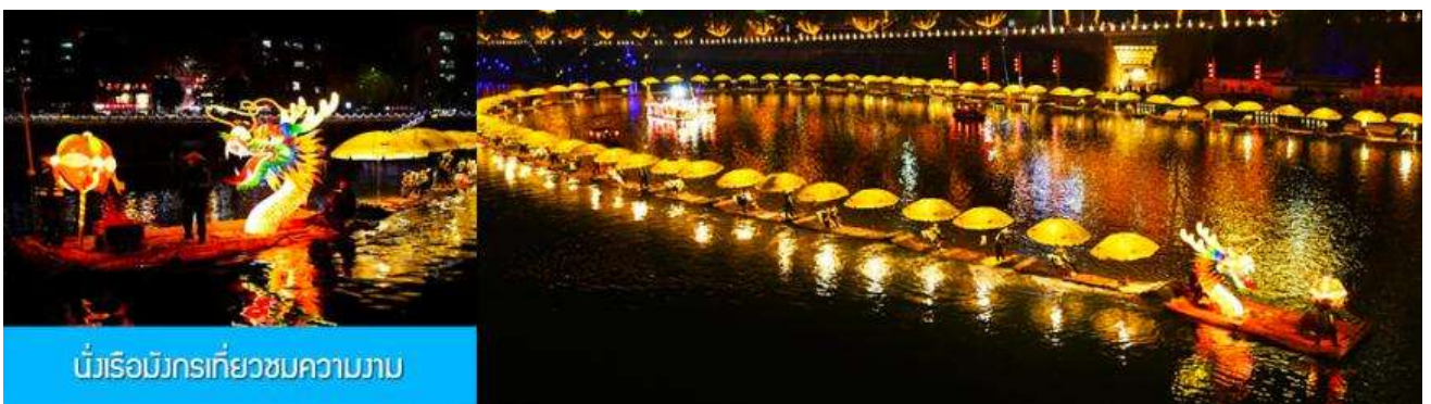
นั่งเรือมังกรเที่ยวชมความงาม

หลังอาหารนำท่านเดินทางเข้าที่พัก หรือท่านสามารถเลือกซื้อ โปรแกรมเสริม เป็นตัวนั่งเรือมังกรเที่ยวชมความงามของบ้านเรือนและสิ่งปลูกสร้างสองฝั่งแม่น้ำในช่วงที่สวยงามที่สุดของเมือง เซียนเอิน ที่ประดับประดาด้วยแสงสี และได้ชื่อว่าเป็นวิวยามค่ำคืนที่สวยงามที่สุดในมณฑลหูเป่ย์ เช่นเดียวกับเมือง โบราณฟงหวงในมณฑลหูหนาน.....อัตราค่าบริการสำหรับโปรแกรมเสริมนั่งเรือมังกรชมวิวยามค่ำคืน ท่านละ 190 หยวน หรือ 950 บาท ระยะเวลาที่ใช้ในการเรือมังกร ประมาณ 45 นาที ค่าบริการรวม ค่าบัตรเข้าชม ค่ารถรับ ส่ง และค่านำเที่ยวของไกด์ท้องถิ่น