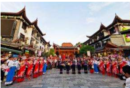
เมืองเทพริดา