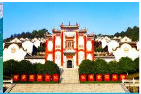
บ้านเกิดกวี ชวีหยวน