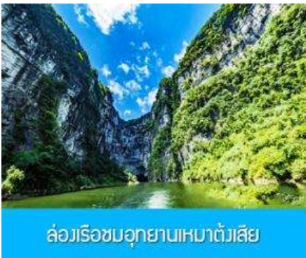
ล่องเรือชมอุทยานเหมาดั่งเสี่ย