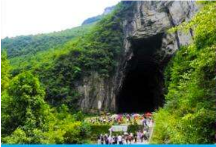
ถ้ำผญามังกร

พักที่ YICHANG HUIHAO HOTEL โรงแรมระดับ 4 ดาวหรือเทียบเท่าในเมืองหฺยี่ซัง