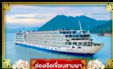
ล่องเรือเจ็อนสามผา