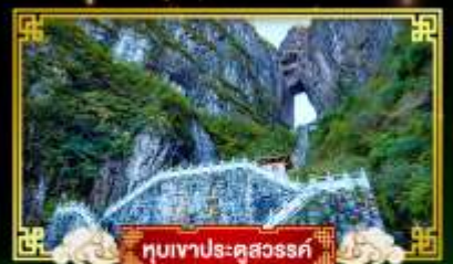
หุบเขาประติมากรรม