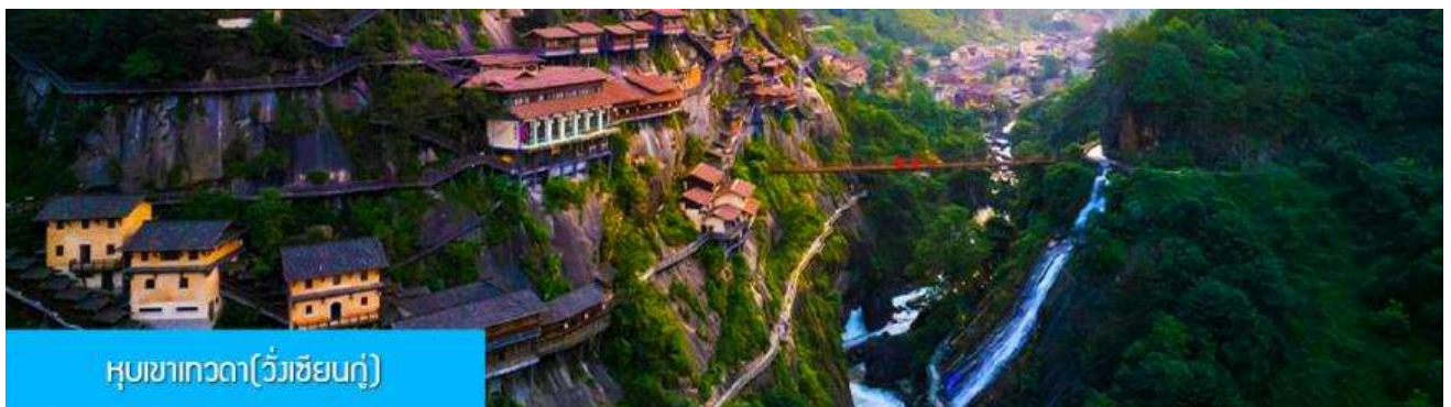
หุบเขาเทวดา(วังเซียนกู่)

หลังอาหารเช้าท่านเดินทางสู่เมือง ซังเหรา 上饶 (ระยะทาง 127 กม. ใช้เวลาเดินทางโดยรถบัสราว 2 ชั่วโมง)