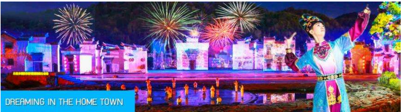
DREAMING IN THE HOME TOWN

หลังอาหารนำท่านเดินทางเข้าที่พัก หรือท่านสามารถเลือกซื้อ โปรแกรมเสริม เป็นบัตรชมการแสดง ชุด DREAMING IN THE HOME TOWN เป็นการแสดงบนเวทีขนาดใหญ่ที่จัดสร้างขึ้นกลางแจ้ง ท่ามกลางธรรมชาติที่มีภูเขาเป็นฉากหลัง ใช้ทุนสร้างกว่า 280 ล้านบาท เป็นการแสดงที่น่าดูชมที่สุดในมณฑลเจียงซี แต่ละฉากการแสดงมีการออกแบบเวที ฉากประกอบที่พิถีพิถัน ประณีต และอลังการ ใช้ทีมงานนักแสดงหลายร้อยคน และระบบแสง สี เสียงที่ทันสมัยประกอบในการแสดง