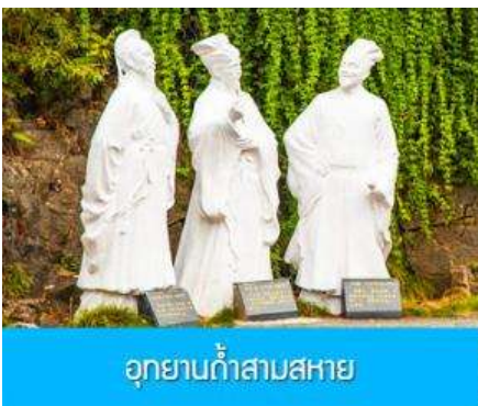
อุทยานก้ำสามสหาย

ค่ำ รับประทานอาหารค่ำ ณ ภัตตาคาร หลังอาหารเช้าท่านเข้าสู่โรงแรมที่พัก พักที่ XIA ZHOU BINGUAN HOTEL โรงแรมระดับ 4 ดาวหรือเทียบเท่าใจกลางเมืองหยีชาง