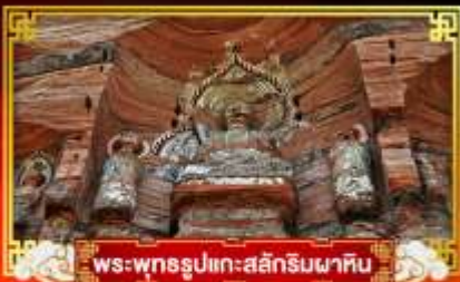
พระพุทธรูปแกะสลักหินผาศิน