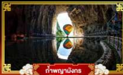
ถ้ำผานางมิ่งกร