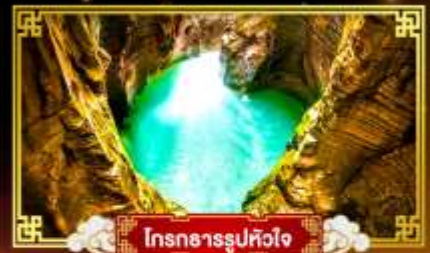
โตรกธารรูปหัวใจ