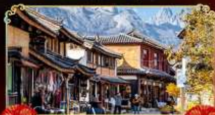
เมืองเก่าไปซา