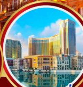
เดอะเวเนเซียน