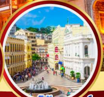
เซนาโดสแควร์