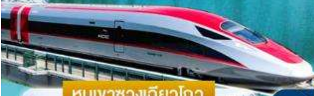
หุบเขาซวงเฉียวโกว