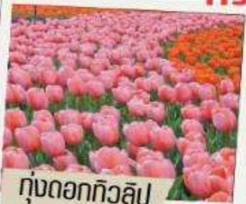
ทุ่งดอกทิวลิป