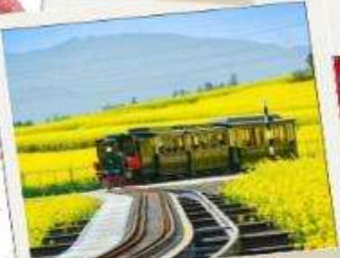
ทุ่งดอกทุ่งดอก มัสตาร์ด