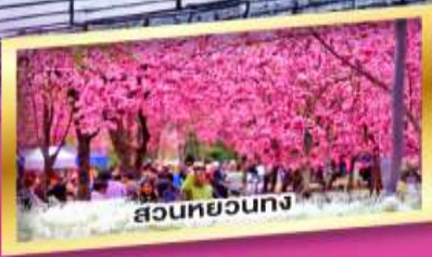
สวนหยวงทง