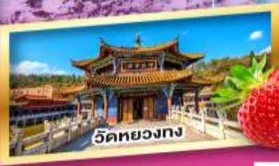
วัดหยวงทง