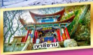
เวาชีซาบ