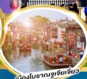
เมืองโบราณจู่เจียเจี้ยว