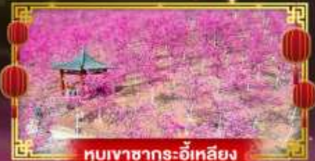
หุบเขาซาถูเอ้อเหลียง