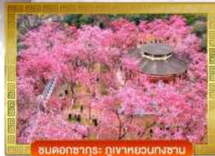
ชมดอกซากุระ ภูเขาหยวงงซาน