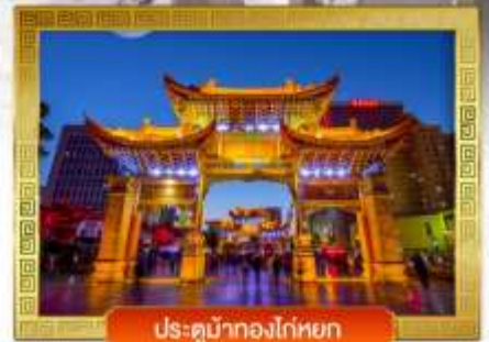
ประตูน้ำทองโก่หยก