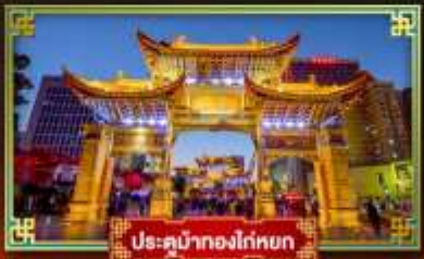
ประตูน้ำทองโตเกียว