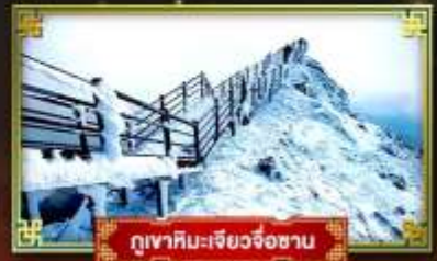
ภูเขาหิมะเจียวจื่อซาน