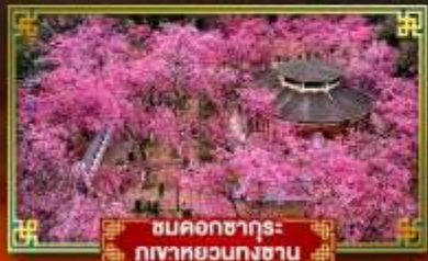
ชมดอกซากุระ ภูเขาหอยงวงซาน