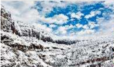
ภูเขาหิมะเจียวจื่อ