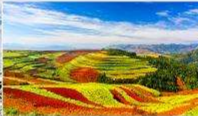
แผ่นดินสีแดง