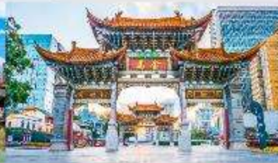
ประตุน้ำทอง ไท่หยก

*ทางบริษัทฯ ขอสงวนสิทธิ์ในการสลับโปรแกรมทัวร์ตามความเหมาะสมขึ้นอยู่กับสถานการณ์หน้างาน โดยคำนึงถึงผลประโยชน์ของลูกค้าเป็นสำคัญ