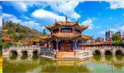
วัดหยวนทง