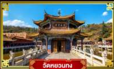
วัดหยวงง

นั่งกระเช้าขึ้นสู่อยอดภูเขาหิมะเจี๋ยจื่อ