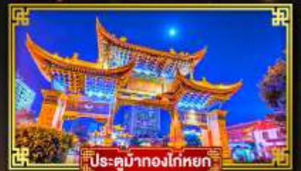
ประตูม่านทองโตหยก