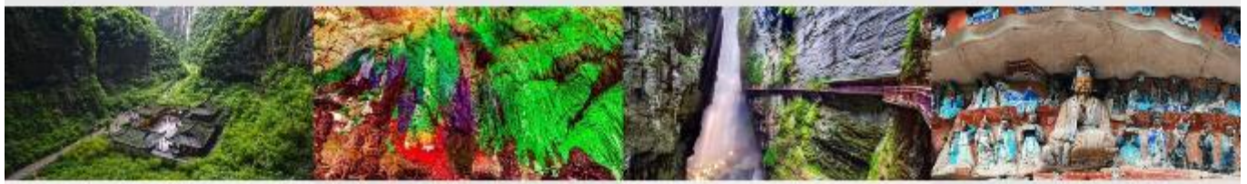
อุทยานแห่งชาติหลุมฟ้า 3 สะพานสวรรค์ ถ้ำผุหยงตั้ง หุบเขารอยแยกอู่หลิงซาน ผาหินแกะสลักต้าจู๋ เขาเป่าติงซาน