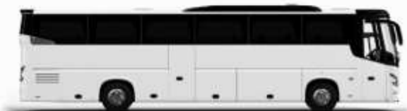
ตัวอย่างรถพลาทอน 1 ชั้น

ค่าที่พักตามที่ระบุในรายการหรือเทียบเท่าระดับเดียวกัน (พิกห้องละ 2 ท่าน) หากประเภทห้องที่ท่านริเสวนาเดิม อาทิ เช่น ริเสวนาห้องพักเป็น TWIN BED หรือ DOUBLE BED ทางบริษัทขอสงวนสิทธิ์ในการปรับประเภทห้องพัก เป็นตามที่โรงแรมมีอยู่ โดยไม่ต้องแจ้งให้ทราบล่วงหน้า