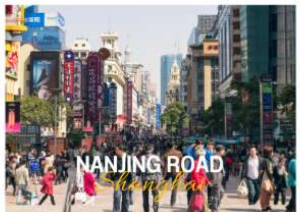
NANJING ROAD Shanghai

ถนนหนานจิง หรือที่รู้จักกันอีกชื่อว่า นานกิง ย่านช้อปปิ้งที่เก่าแก่และมีชื่อเสียงที่สุดในเซี่ยงไฮ้เลยในตอนเย็นจะเป็นช่วงที่ร้านค้าและบาร์ต่างๆกำลังคึกคักมีนักดนตรีริมถนนเต็มไปด้วยแสงสีเสียงเหมาะกับการเดินเล่นหรือนั่งรถรางชมบรรยากาศรอบๆฝั่งตะวันตกจะมีห้างสรรพสินค้าใหญ่ๆสลับกับร้านแบบจีนดั้งเดิมอยู่ตลอดสองข้างทาง