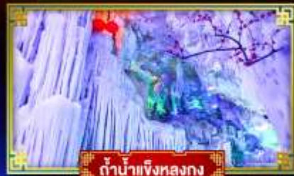
ถ้ำน้ำแข็งหลงกง

"เที่ยว 2 มณฑล กวางซี-กัชโจว" สุดอลังการ น้ำตก 2 พรมแดน แหล่งท่องเที่ยวระดับ 5A