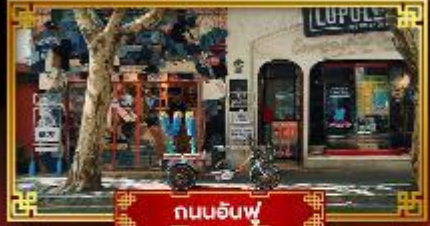
ถนนฮันฟู่