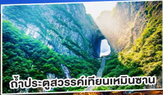
ถ้ำประตูสวรรค์เทียนเหมินชาน

สัมผัสมนต์ขลังฟูหรงเจิ้น พิษิตระเบียงแก้วเทียนเหมิน