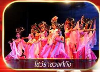
โชว์ราชวงศ์กั๊ง

สัมผัสความยิ่งใหญ่อลังการกองทัพจีนสี่ฮ่องเต้ นั่งรถไฟความเร็วสูงทะลุเมืองโบราณ ย้อนตำนานประวัติศาสตร์จีน