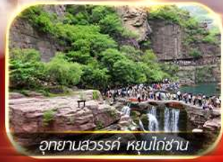
อุทยานสวรรค์ หยูนไต้ชาน