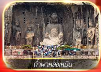
ท้าพหลงเหมิน