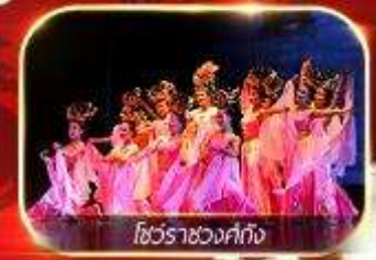
โชว์ราชวงศ์ถัง

สัมผัสความยิ่งใหญ่อลังการกองทัพจีนสี่ฮ่องเต้ นั่งรถไฟความเร็วสูงทะลุเมืองโบราณ ย้อนตำนานประวัติศาสตร์จีน