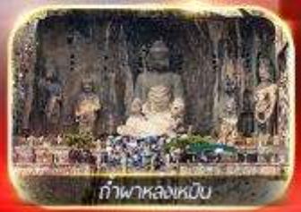
ถ้ำพาล่งเหมิน