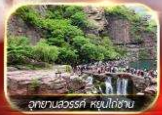
อุทยานลวอร์ร่า หุยโกซาน