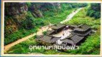
อุทยานหลุมฝังศพ