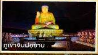
ภูเขาจินฝ่อชาน