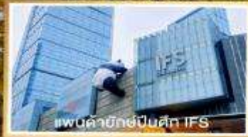
แพนด้ายักษ์ปิ่นสี IFS