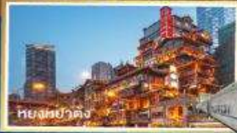
หยงหย่าตง