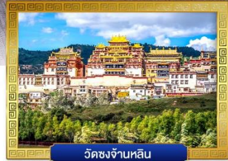
วัดชงจ้านหลิน