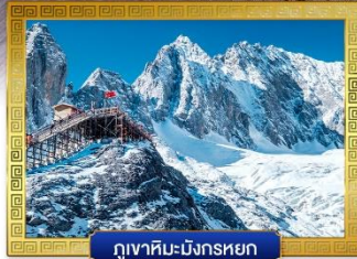
กุเวาเหมยหลี่