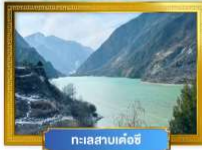
ทะเลสาบเค่อซี