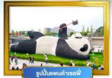
รูปปั้นแพนด้าเซฟี่