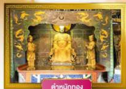
ตำหนักทอง