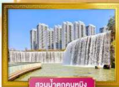
สวนน้ำตกคุนหมิง