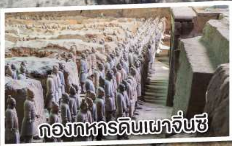
ก่องทหารดินเผาจิ๋นซี