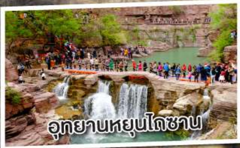
อุทยานหยุนโกซาน