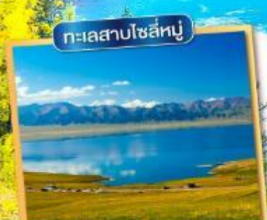
ทะเลสาบโซลันบู

ประกันสุขภาพอุบัติเหตุ คุ้มครองสูงสุด 3,000,000 *ตามเงื่อนไขกรมธรรม์ประกันภัย*