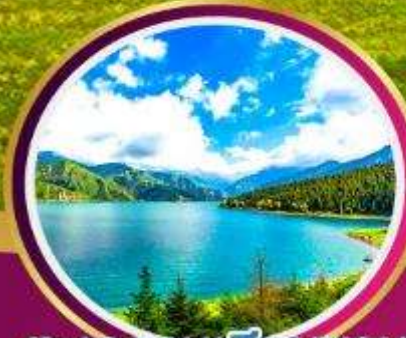
ทะเลสาบเทียนชาน