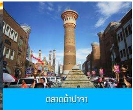
ตลาดต้าปาจา

วันที่เจ็ด แกรนด์แคนยอนตูซันจื่อ – เมืองูรูมูฉี -ตลาดต้าปาจา