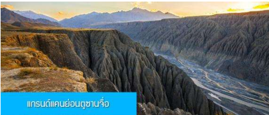
แกรนด์แคนยอนตูซันจื่อ

พักที่ RUI JING HOTEL โรงแรมระดับ 4 ดาวท้องถิ่นหรือเทียบเท่าในเมืองชุยถุน