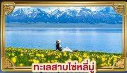
ทะเลสาบโซหลี่มู่