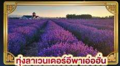
ทุ่งลาเวนเดอร์อิฟาอ้อฮัน