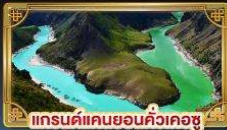
แกรนด์แคนยอนคิ้วเคอซู