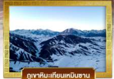
ภูเขาหิมะเทียนเหินซาน

เดินทางโดยสายการบินโซน่าชาท์เทิร์นแอร์ไลน์