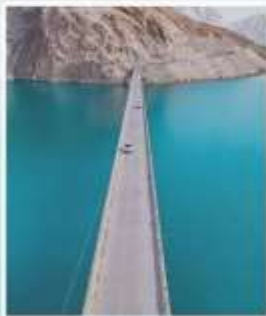
ทะเลสาบบันดี้ร์ บลูลากูน