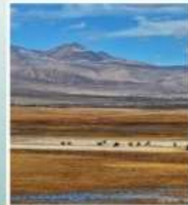
ที่ราบชุ่มน้ำท่าเหมอ่มา