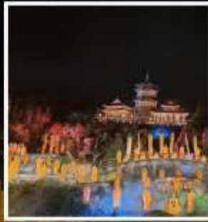
โชว์ SHAOLIN MUSIC CEREMONY