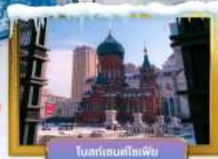
โบสถ์ซอโศเฟีย

เดินทางโดยสารบินโซน่า เซาเทิร์น แอร์ไลน์