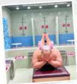
คาเฟ่ผ่อนคลายเหอผิง