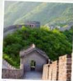
กำแพงเมืองจีนด่าน จี้หยงกวน