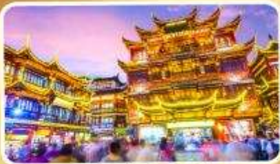
ตลาดร้อยปีเจิ้งหวิงเมี่ยว