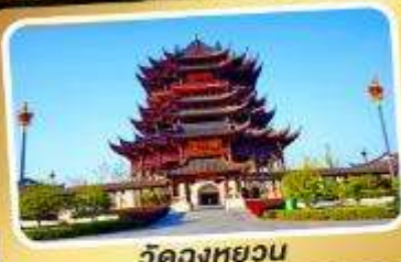
วัดหลงหยวน