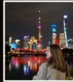
SHANGHAI (CLASSIC NIGHT)