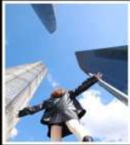
เช็กเมบู 3 ตึกใหญ่ แห่งเซี่ยงไฮ้