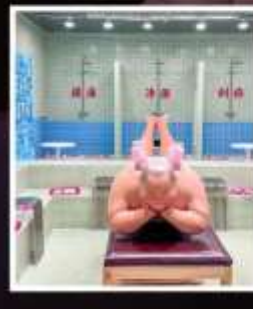
คาเฟ่ย้อนยุคเหอผิง