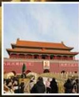
จัตุรัส เทียนอันเหมิน