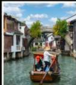
เมืองโบราณ จูเจียเจี้ยว