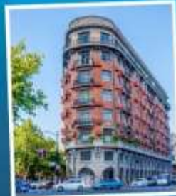
ถนนอู่คัง