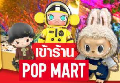
เข้าร้าน POP MART