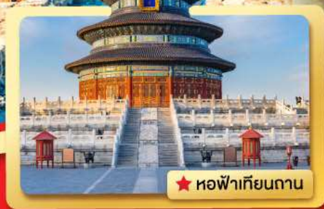
★ หอฟ้าเทียนถาน

เที่ยวเมืองหลวงของประเทศจีน.. ชมประวัติศาสตร์ที่ยิ่งใหญ่ พบกับ..อารยธรรมเก่า.. ความเจริญของยุคปัจจุบัน.. ที่ผสมผสานกันอย่างลงตัว