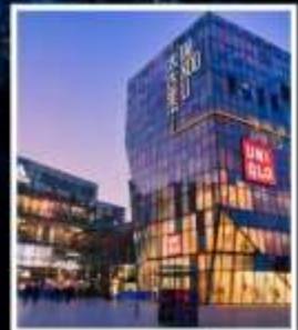
ย่านชานหลี่ถุน