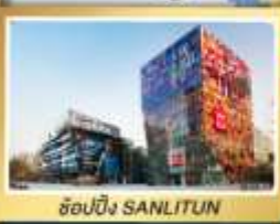
ช้อปปิ้ง SANLITUN