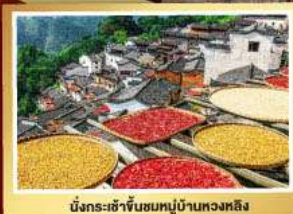
นึ่งกระเช้าขึ้นชมหมู่บ้านหวงหลิง