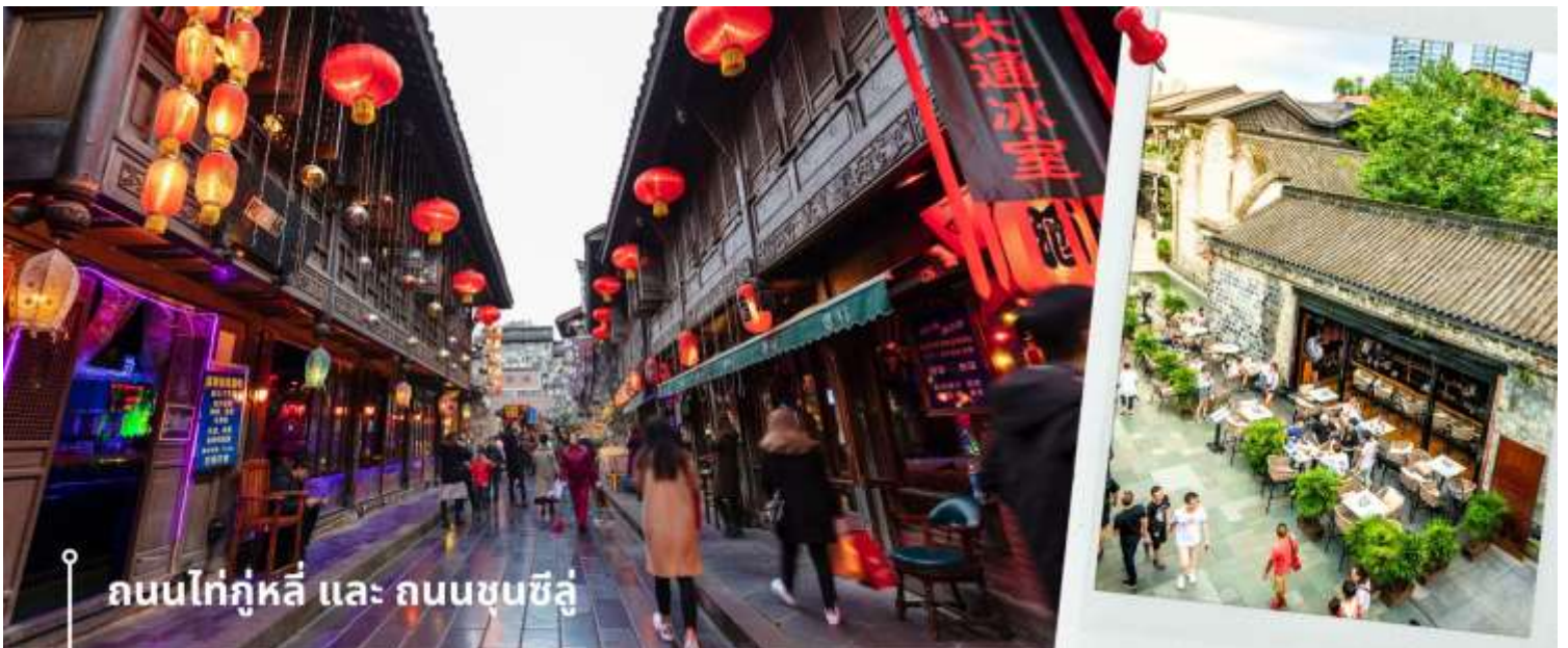
ถนนไท่กู่หลี่ และ ถนนชุนซีลู่

ชมสะพานโบราณอันซุน-พร้อมชมแสงสียามค่ำคืน ตึกแฝดเทียนฟู่ เป็นสะพานข้ามคลองที่สร้างเป็นเหมือนอาคารอยู่ข้างบน ในช่วงเวลายามเย็นจะเป็นช่วงที่ผู้คนออกมาชมบรรยากาศบริเวณของสะพานแห่งนี้ และมีร้านค้ามากมาย รวมไปถึงบาร์เครื่องดื่มต่างๆ ที่ดึงดูดนักท่องเที่ยวได้เป็นอย่างดี เป็นสะพานที่ทอดข้ามแม่น้ำจินเจียง และเป็นรูปแบบสะพานมีหลังคา ตามลักษณะสถาปัตยกรรมจีนโบราณ อายุมากกว่า 300 ปี และในบริเวณใกล้เคียงกัน ยังเป็นที่ตั้งของ ตึกแฝด